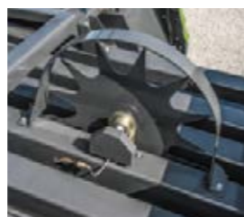
■ Einfaches Anpassen mit der elektrischen Ballenlängenverstellung.