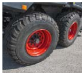
■ Die nachlaufgelenkte Tandemachse garantiert eine große Aufstandsfläche bei hoher Wendigkeit.