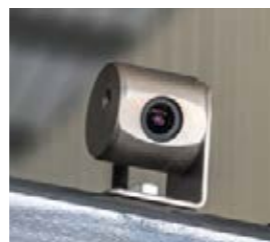
□ Perfekter Überblick mit der optionalen Rückraumkamera.