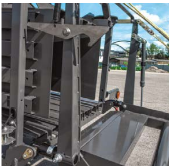
■ Die Sensoren der Ballenwaage zwischen der Presskammer und Ladeschurre messen genau das Gewicht des Ballens und senden die Daten gleich weiter zu Ihrem Terminal. Durch die integrierte Verkabelung im Chassis ist das System geschützt und Kabel können nicht so leicht herausgerissen werden.