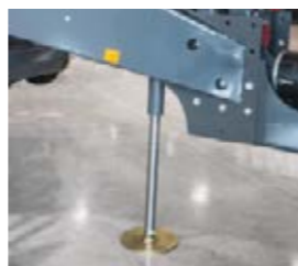
□ Der optional erhältliche hydraulische Stützfuß ermöglicht ein einfaches und schnelles An- und Abhängen des Traktors.