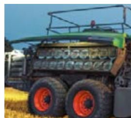
■ Die LED-Arbeitsbeleuchtung ermöglicht auch bei Dunkelheit ein schnelles und einfaches Befüllen und Verknoten.