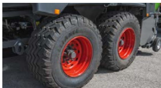
■ Die Fendt Squadra 1290 UD ist für eine Außenbreite unter drei Metern mit zwei unterschiedlichen Bereifungen verfügbar: 620/50R22,5 oder 620/55R26,5.