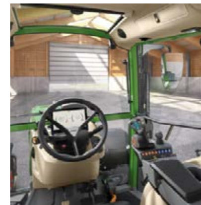
Power Setting 2