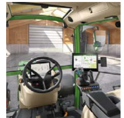
Profi+ Setting 2