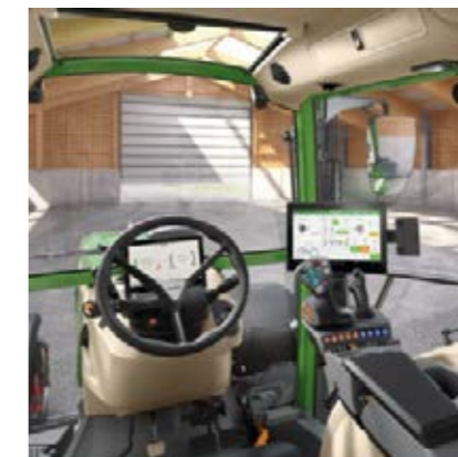
Profi Setting 2