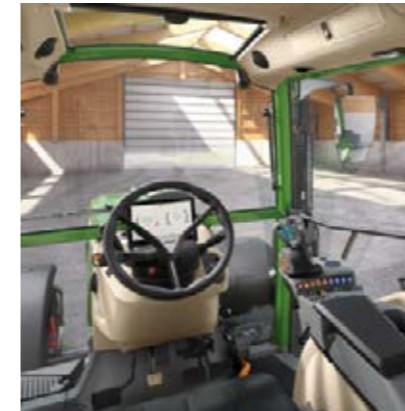
Power Setting 1

Pro Ausstattungsvariante kann zwischen zwei verschiedenen Settings gewählt werden. Die Abbildungen zeigen die unterschiedlichen Linien mit optionalem Zubehör.