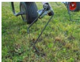
Foderet samles op med den 7,5 cm lange krog på Fendt Performance-tænderne.