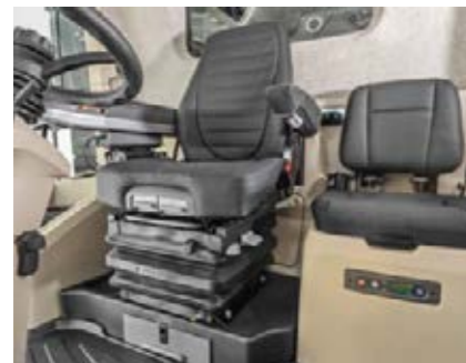
□ Asiento del operador Deluxe