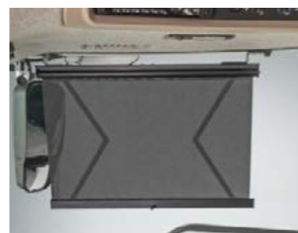
□ Solgardiner til sidevindue