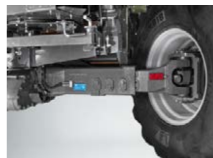
□ AllDrive 4WD