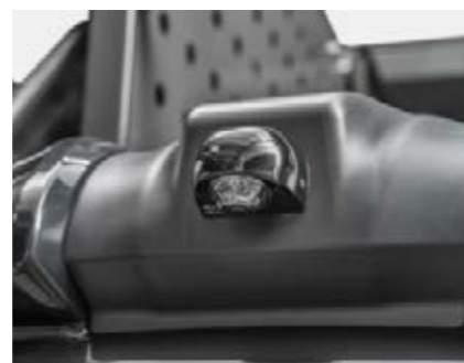
□ 360° kamerasystem