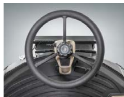
■ Konvensjonell styring