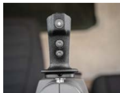
□ IDEALDrive – styring med kjørespak