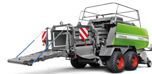
Wymiary kostek 12130 (szer. x wys. x dł.) 1200 x 1300 x do 2740 mm