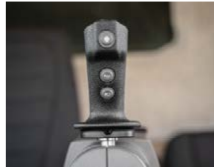
□ IDEALDrive – układ kierowniczy z joystickiem