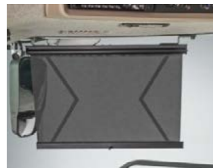
□ Rolety na okna boczne