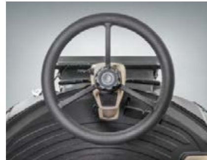
■ Konwencjonalny układ kierowniczy