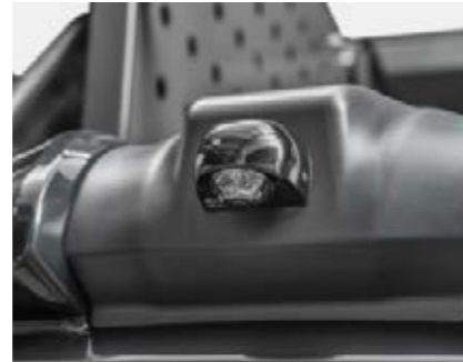
□ Układ kamer o zasięgu 360°