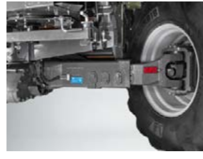
□ Napęd na 4 koła AllDrive