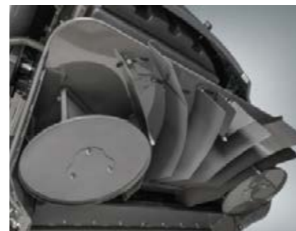
□ ActiveSpread с электрической регулировкой