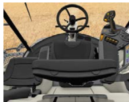
□ Акустическая система Pro Sound