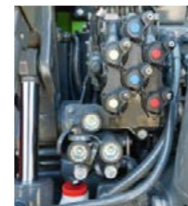
Hydraulanslutningarna är färgkodade. Det gör att du kan ansluta enheter både snabbt och säkert.