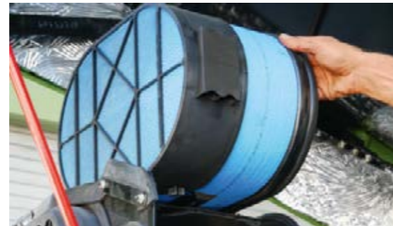
Du byter enkelt luftfilter och filtret är även utrustat med en smutssensor som ger dig information om filtreringseffektiviteten.