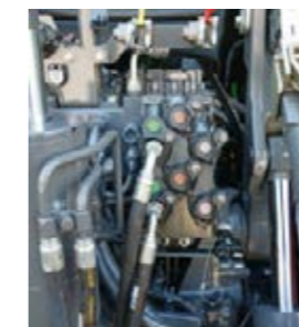
Hydraulsystemet är konstruerat för maximal prestanda och erbjuder prestanda på upp till 440 l/min vid 1 700 rpm.