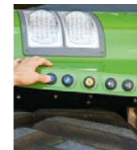
Manövrera den bakre trepunktslyften, kraftuttaget och styrenheten smidigt och bekvämt från de bakre stänkskärmarna.