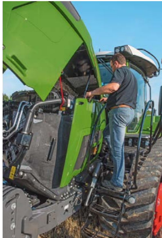
Motorrummet är mycket lättarbetat tack vare de avtagbara sidopanelerna.