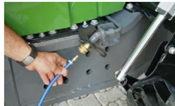
Det finns en tryckluftskoppling i maskinens front som kan användas för att blåsa ut luften från kylaren.