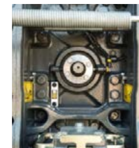
Välj mellan två olika varvtal för kraftuttaget: 1000 och 1000E.