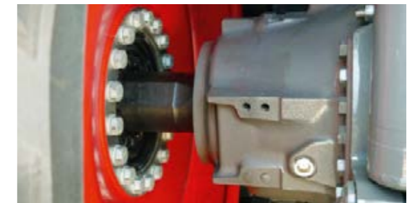
Den robusta bakaxeln är byggd för längsta möjliga livslängd. Den interna oljebalansen kontrolleras enkelt genom inspektionsmätarna.