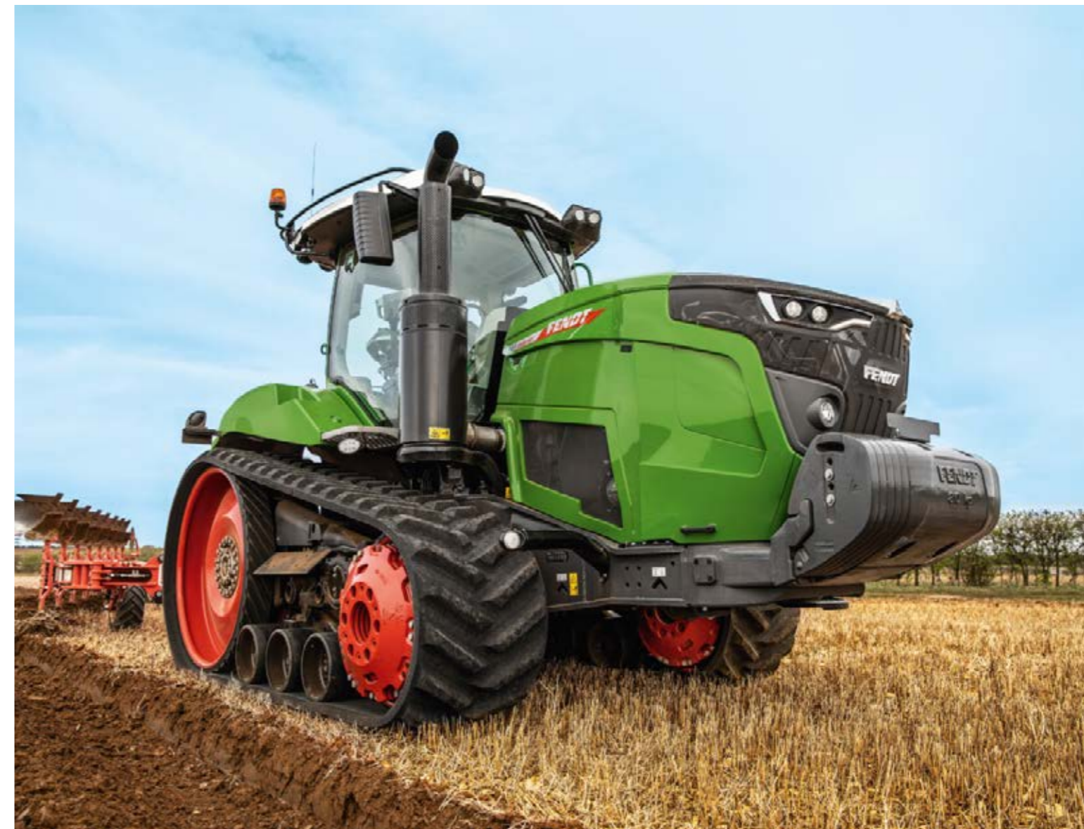
Maximal prestanda på fältet och på vägen: Fendt Vario 900 MT erbjuder en helt ny körupplevelse tack vare Fendt VarioDrive.