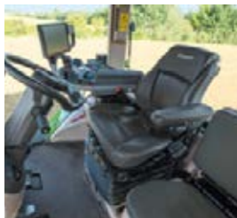
Välj mellan tre olika stolar för att matcha dina individuella behov.