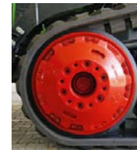
Framhjulen kan balanseras med vikter på upp till 1 580 kg.