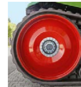
De bakre drivhjulen överför kraften perfekt och driver även rullarna mjukt.