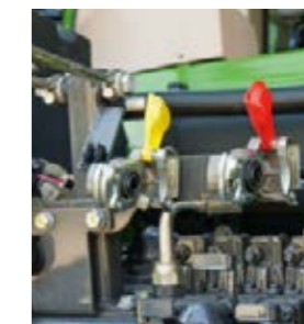
Luftbromsarna med dubbla kretsar bromsar även släpet när parkeringsbromsen är ilagd.