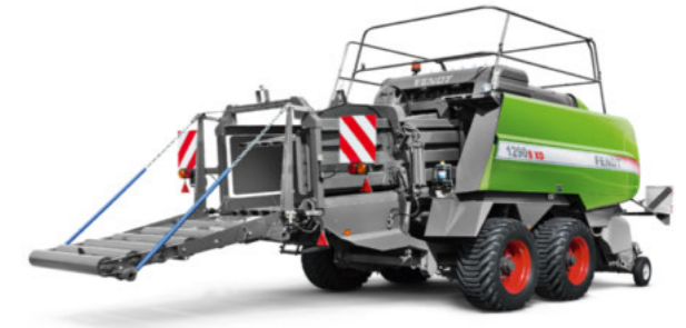
Розмір тюка 12130 (ШхВхД) 1200 x 1300 x до 2740 мм